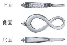
NEW SSR-803 本体寸法：約 10.6×23.2×3.4mm