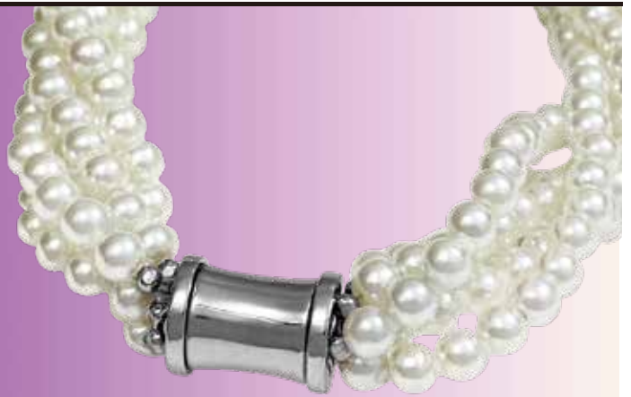
※ 画像は M6-PA-01 の物です、真珠は付属しません。

本体：SV925 ダ円カン：洋白 外観サイズ：10.0mm×13.0mm 内部部品：ネオジム磁石 磁石カバー：ステンレス 仕上げ：ロジウムメッキ（ニッケル下地） 金メッキ（ニッケル下地）