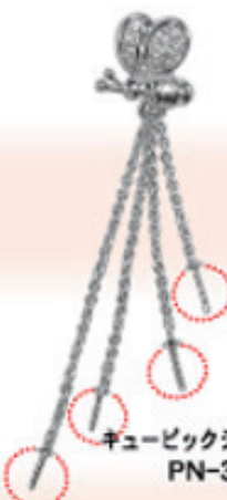
キュービックジルコニア10ヶ PN-391

『ジャラペンダント』にデザインが増えました。小さな真珠を引き立てる 魅力的なデザインです。是非、ご利用下さい。