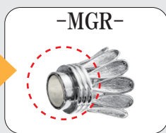
マグネットタイプ

多連用クラスプの定番品 RCL (ロールクラスプ) が 使いやすいマグネットタイプになりました。マグネット 本体にはステンレスの専用カバーが付いているため 衝撃やサビからマグネット本体を保護してくれます。