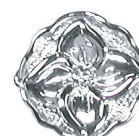
BSC-3002 芯1本 1連、2連、3連