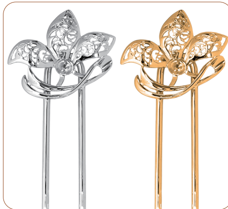
SV+ 真鍮髪飾り・唐草花 【芯立：1本】