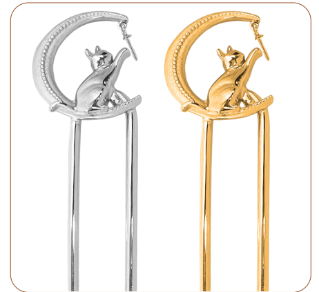
SV+ 真鍮髪飾り・月 / ネコ 【芯立：1本】

仕様 【デコレーション】 SV925 【Uピン】 真鍮 【仕上げ】 ニッケル下地、ロジウムまたは金メッキ