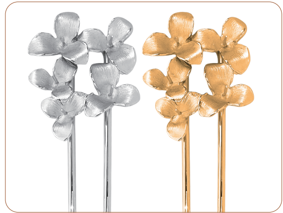
SV+ 真鍮髪飾り・フラワー5花 【芯立：5本】